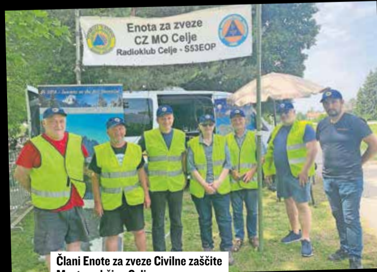
Člani Enote za zveze Civilne zaščite Mestne občine Celje